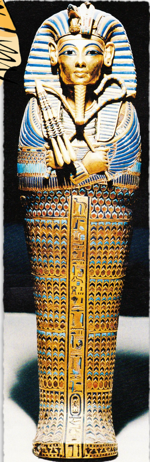
Sarkophag mit der Totenmaske des Pharaos Tutenchamun