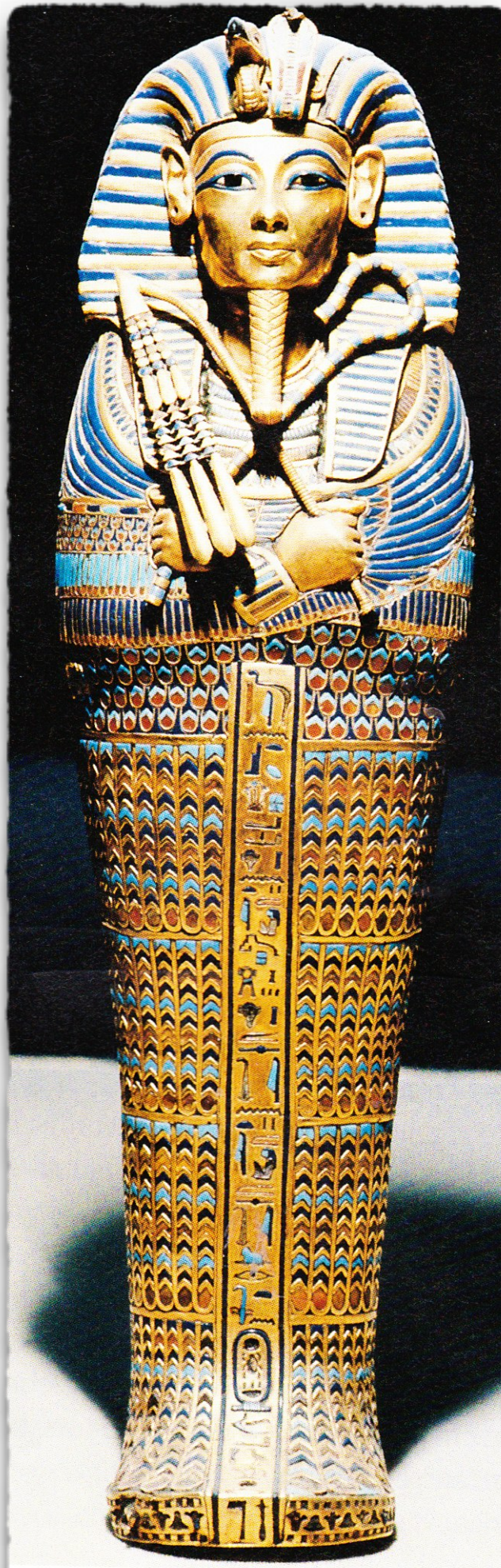
Sarkophag mit der Totenmaske des Pharaos Tutenchamun